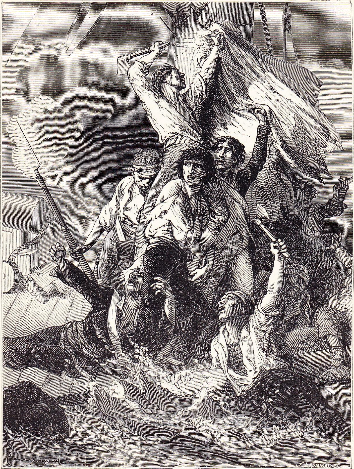
Le vaisseau le Vengeur (Juin 1794).